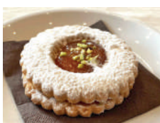
Occhio di bue con marmellata di albicocche Apricot jam