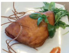
Siciliana Vegetariana Vegetarian Siciliana (eggplant, tomato, and mozzarella)