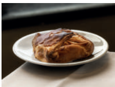
Cipollina (onion, tomato, mozzarella and ham)