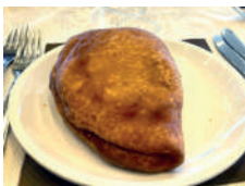
Siciliana Classica Classic Siciliana (tomato, mozzarella, ham and olives)