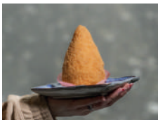
Arancino al ragù Arancino with ragu sauce