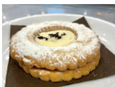
Occhio di bue con Nutella bianca White Nutella