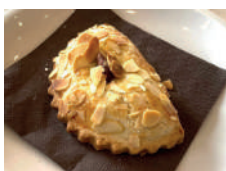
Cassatella di Agira alla mandorla Almond