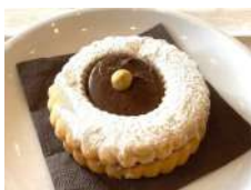
Occhio di bue con Nutella Nutella