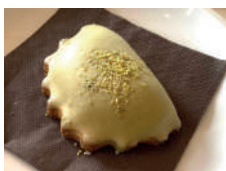
Cassatella di Agira al pistacchio Pistachio