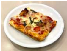
Pizza al taglio Slice of pizza