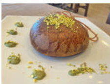
Bomba al pistacchio Pistachio Bomb (pistachio cream, ham and mozzarella)

COPERTO AL TAVOLO € 0,50 A PERSONA COVER CHARGE TABLE € 0,50 PER PERSON